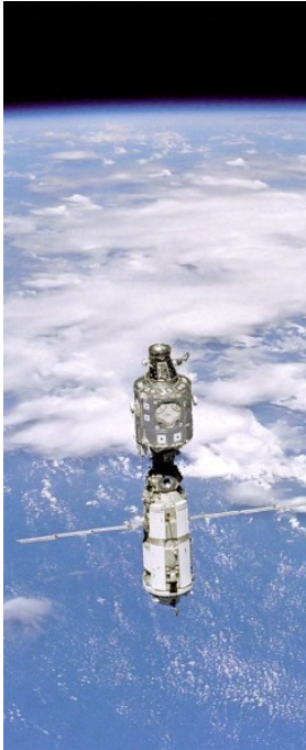
ISS in 1998

Sinds 1998 draait het Internationaal Ruimtestation ISS rondjes om de aarde. In het begin waren er 3 astronauten aan boord. Vanaf 2008 zijn er steeds 6 astronauten aan boord.