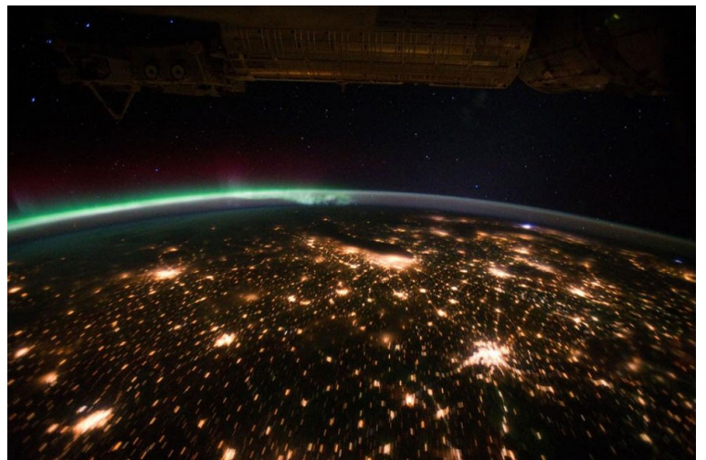
Uitzicht uit het ISS

In december 2002 werd André Kuipers geselecteerd als boordwerktuigkundige voor het Internationale Ruimtestation ISS. In april 2004 maakte hij deel uit van de Delta-missie. Kuipers verbleef ruim een week aan boord van het ISS en voerde daar wetenschappelijke experimenten uit op het gebied van biologie, geneeskunde, technologische ontwikkeling, natuurkunde en aardobservatie.